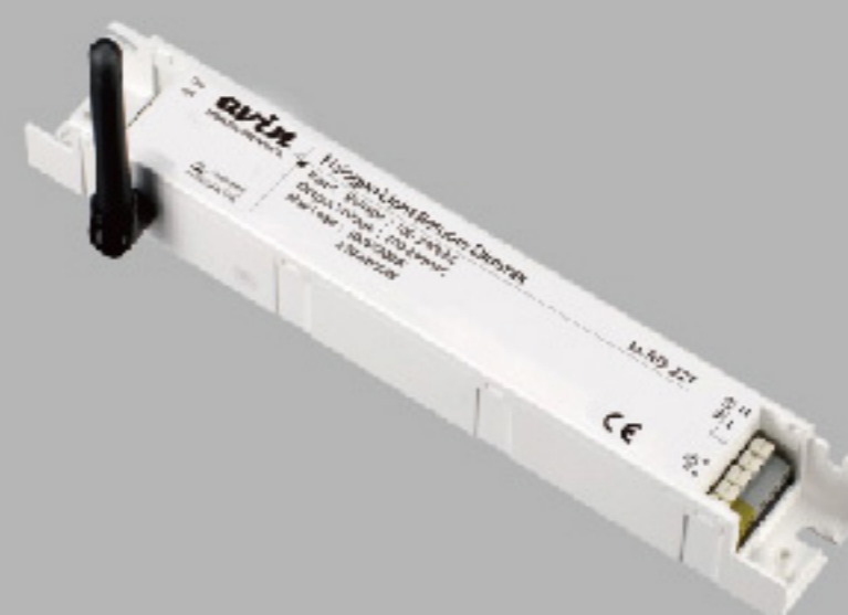
LCRD-22T 相位調變無線調光接收器