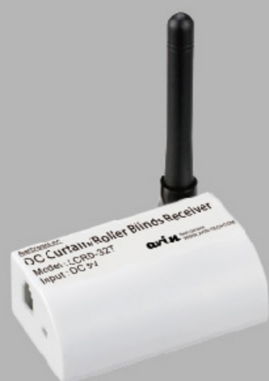
LCRD-32T DC窗簾/捲簾無線控制接收器